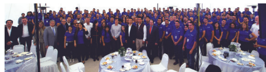
Directivos, autoridades y empleados, se unieron en la celebración de la inauguración oficial de la empresa Merit en Matamoros, Tam.