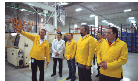
Autoridades e invitados realizaron un recorrido por las instalaciones de la empresa Merit