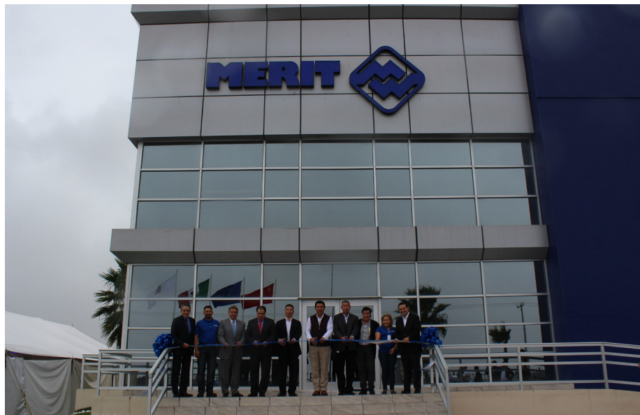
Autoridades estatales y locales de Matamoros, Tam., así como altos ejecutivos del consorcio Merit asistieron al corte de listón inaugural de su planta de operaciones en el Parque Industrial Los Palmes