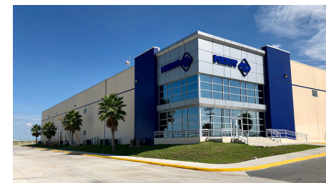
Merit ocupa en el Parque Industrial Los Palmes un área de construcción total: 149,240 pies cuadrados